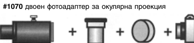
#1070 двоен фотоадаптер за окулярна проекция